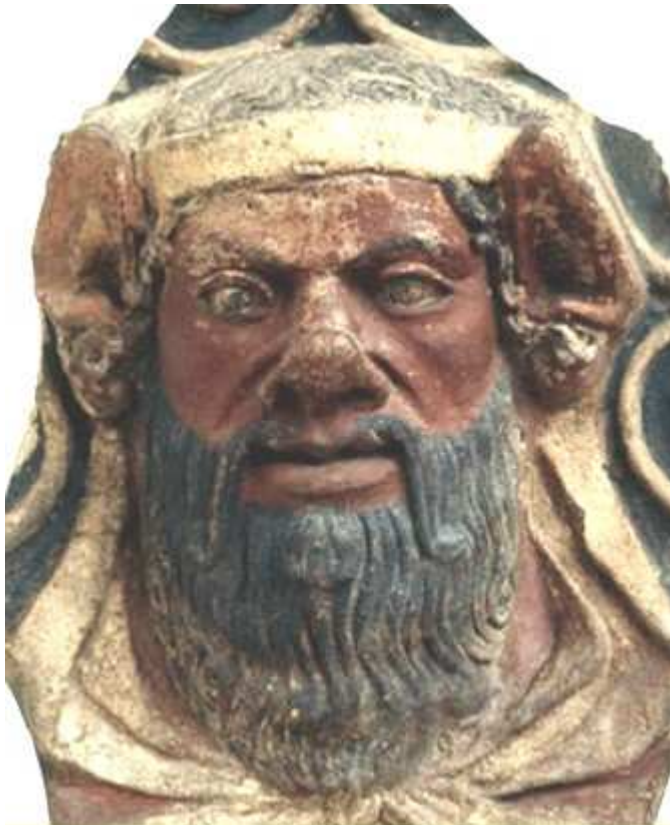
Etruscan, 400-300 B.C.

The Etruscans are believed to be the founders of Rome by many scholars. The Etruscans appear to have depicted themselves as black more so than white in art and craftwork.