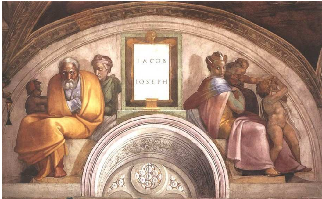
Painting by Michelangelo in the Sistine Chapel of the Vatican: Labelled 'Jacob, Joseph'. On the left side sits Jacob, with his wife Rachel and her first son Joseph. On the right side is said to be Mary of Nazareth and her husband Joseph.

though the skin color of both men seems to be the same, we can see that one of the men awaiting the same is far lighter than the one holding the knife.