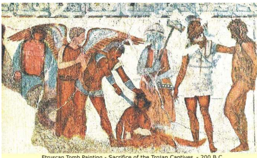
Etruscan Tomb Painting - Sacrifice of the Trojan Captives - 200 B.C.

Naturally, one can argue that the color of the figurine's face may have more to do with the clay that was used than with a depiction of an Etruscan person. That however does not account for the other colors we can find on the figurine that did not seem to have a problem with the clay, but let us examine other depictions from the same people.